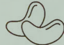
FRUTOS CON CÁSCARA